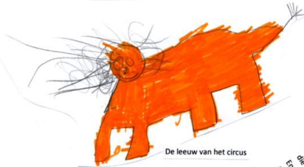
De leeuw van het circus